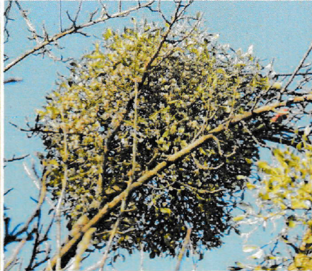
Mistel mit Früchten