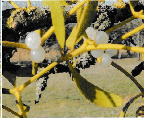
Früchte der Mistel