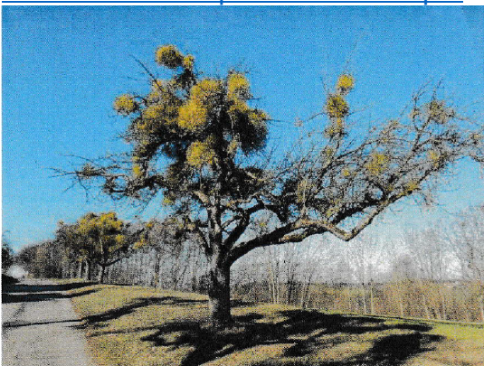
stark befallene Bäume