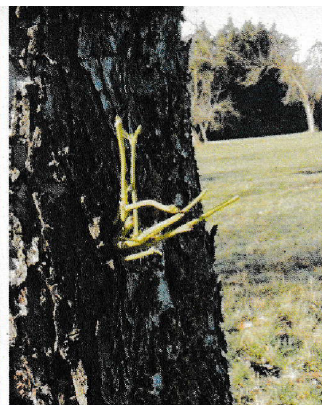
Austrieb aus Stamm